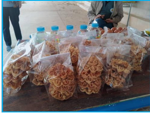
ข้อมูล ณ วันที่ ๑๙ เดือนธันวาคม พ.ศ. ๒๕๖๔